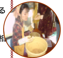
みそ玉、ば〜ん！〜でストレス解消♡