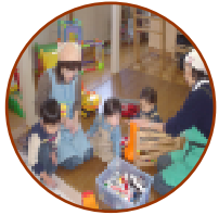
ぼくたち、いい子であそんでるよ！