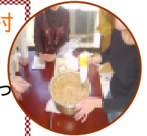
一晩浸した大豆を圧力なで煮てつぶします。

2回目の参加となる方は「大豆のつぶし方」や「みそ玉の投げ方」も手馴れたものです。初めての方